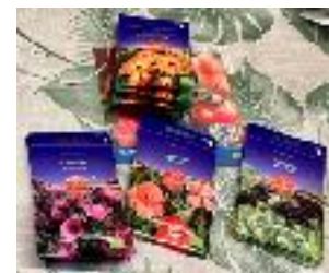
deel van het bloemenzaad