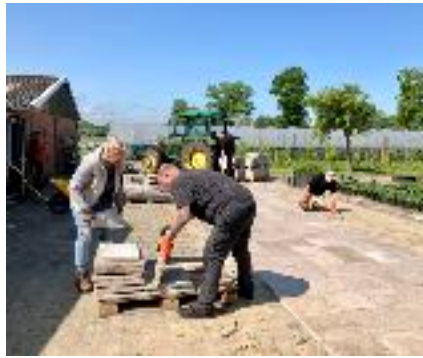
aanleg terras / aardbeiplanten