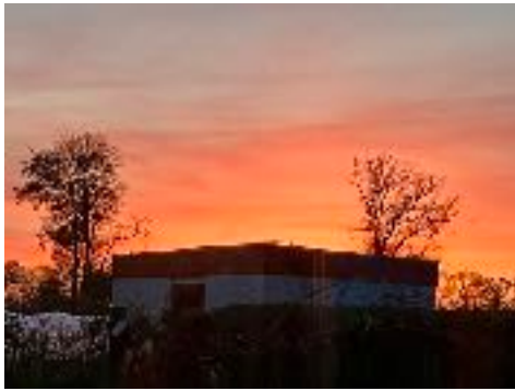
toiletunit bij avondrood