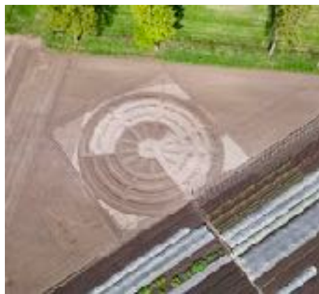
bloemencirkel drone opname