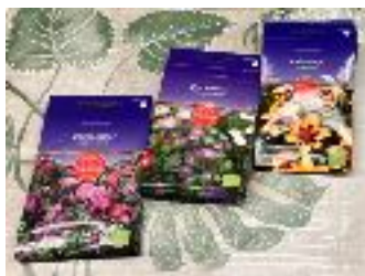
deel van het bloemenzaad